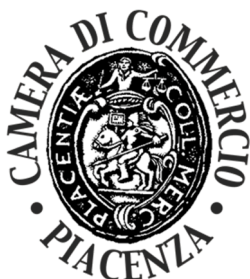
IMMAGINE LOGO SEDE DI PIACENZA:

Composizione ovoidale recante all'interno in senso circolare, le scritte in caratteri bodoniani maiuscoli Camera di Commercio – Parma e minuscoli: Industria, Artigianato, Agricoltura con al centro la raffigurazione di una ruota dentata sovrastata da una spigagermoglio.