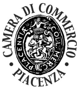
IMMAGINE LOGO SEDE DI PIACENZA:

Composizione ovoidale recante all'interno in senso circolare, le scritte in caratteri bodoniani maiuscoli Camera di Commercio – Parma e minuscoli: Industria, Artigianato, Agricoltura con al centro la raffigurazione di una ruota dentata sovrastata da una spigagermoglio.