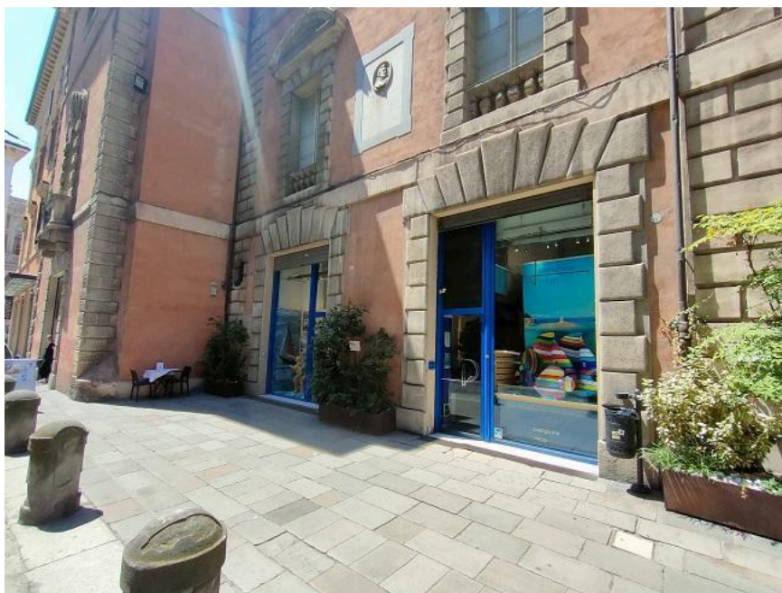
fronte su Via Castiglione

L'unità dispone di utenza telefonica, idrica, elettrica, con forniture autonome. E' presente un impianto di climatizzazione in pompa di calore. L'unità partecipa ad un condominio costituito.