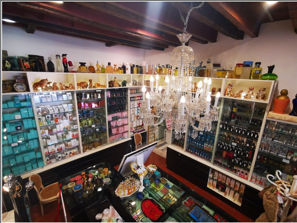
Vista interna negozio Piazza Galvani 1/A