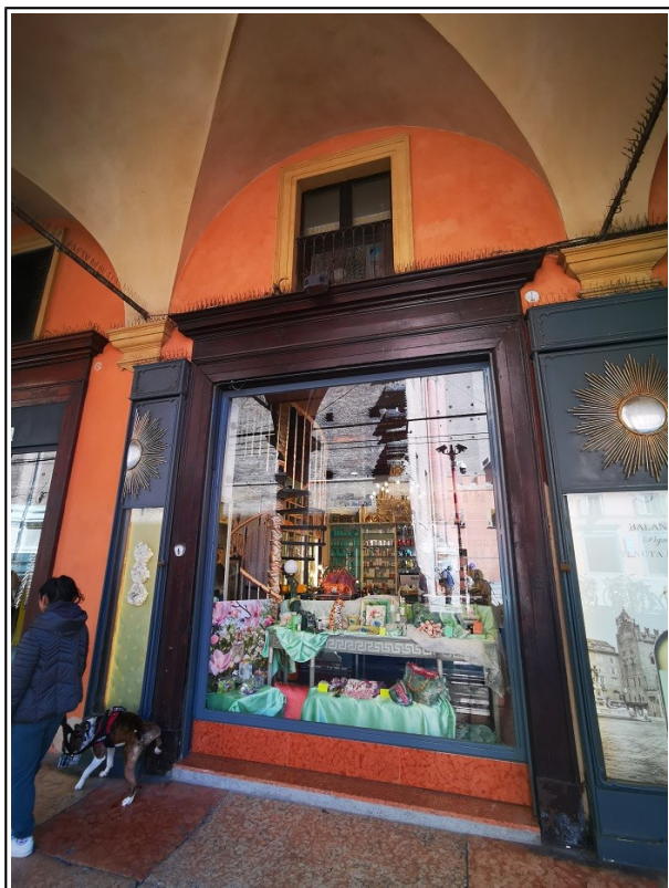
Vetrina negozio Piazza Galvani 1/A