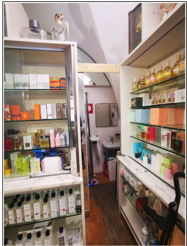
Vista "ripostiglio con lavandino" piano ammezzato