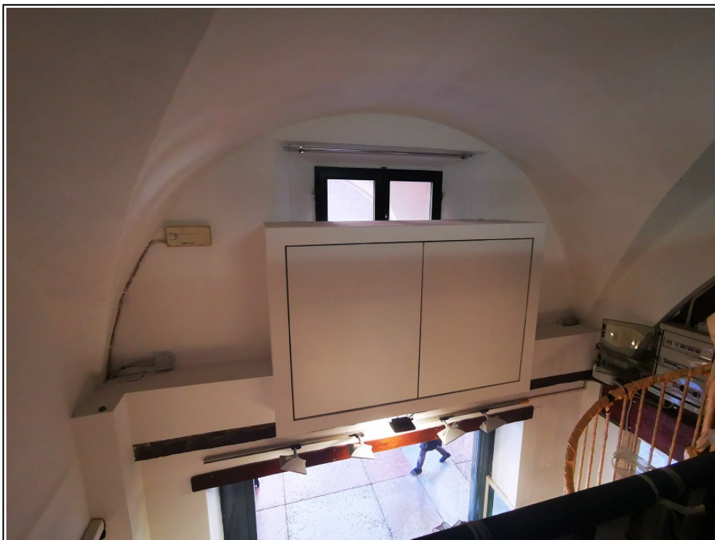
Vista interna piano ammezzato