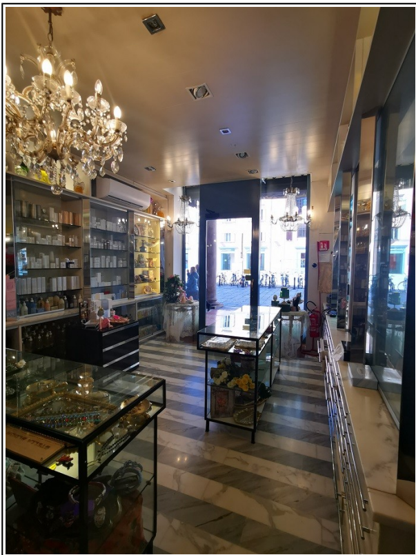
Vista vetrina interna negozio Piazza Galvani 1/B