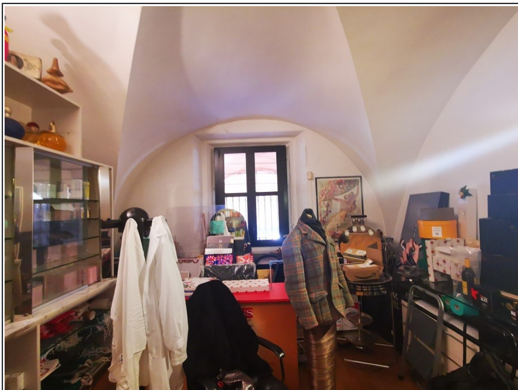
Vista interna piano ammezzato