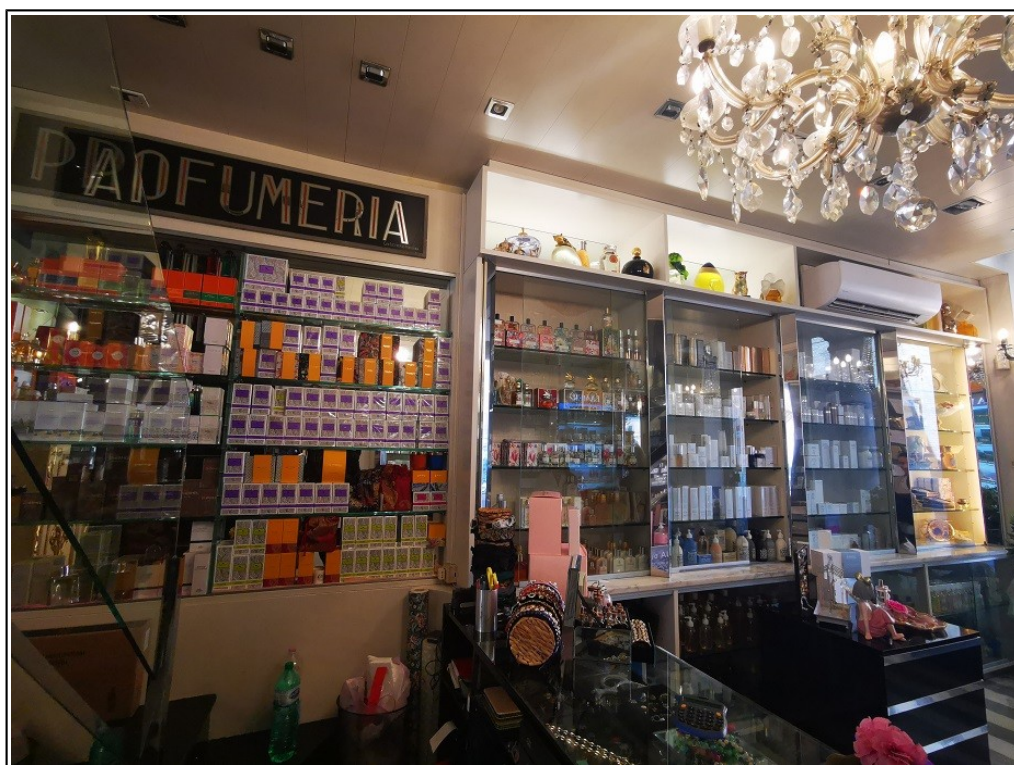
Vista interna negozio Piazza Galvani 1/B