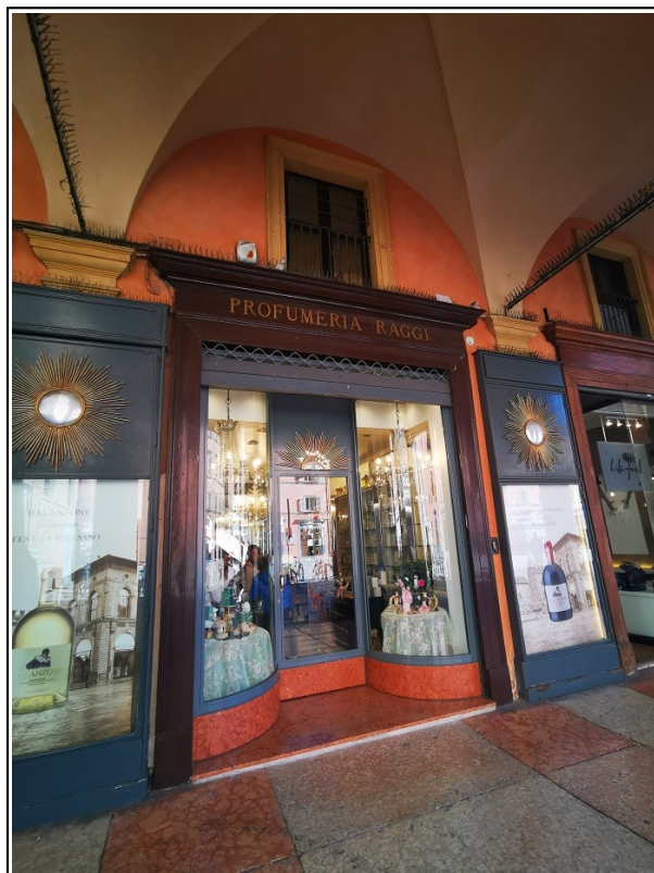
Vetrina di accesso negozio Piazza Galvani 1/B