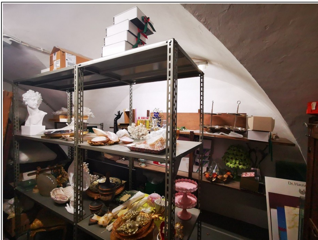
Vista interna piano ammezzato