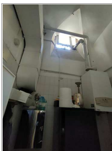
vista degli interni