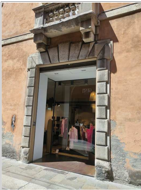
accesso da Via Castiglione n.7