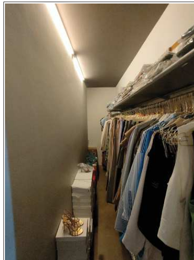
vista degli interni