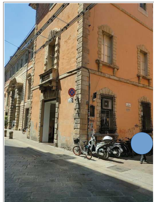
angolo Via Castiglione – Via Clavature