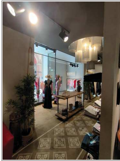
vista degli interni