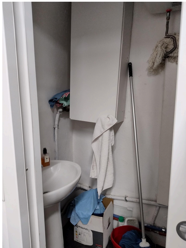
Lavatoio piano ammezzato