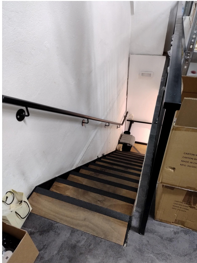
Scala di accesso al piano ammezzato