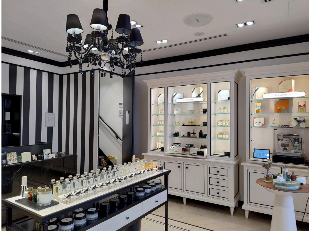
Vista interno Piano Terra