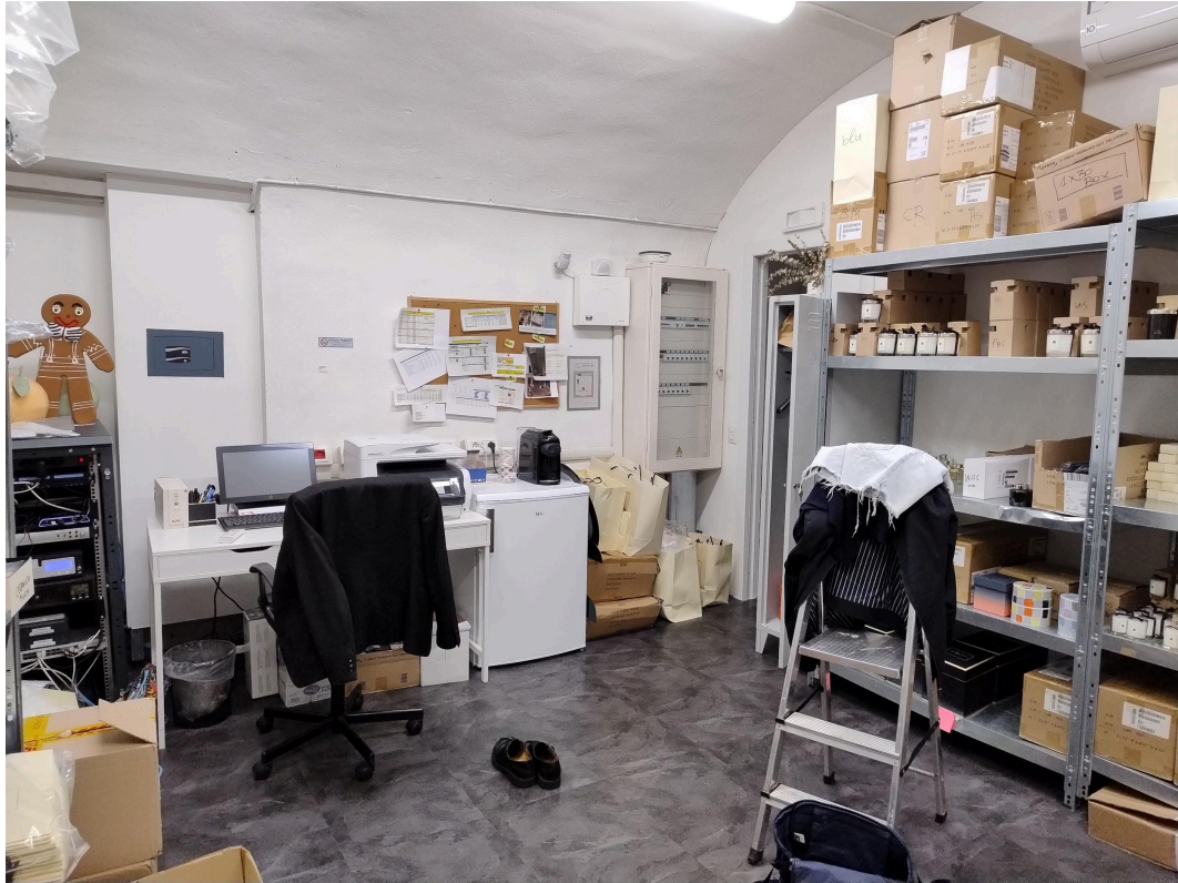
Magazzino piano ammezzato