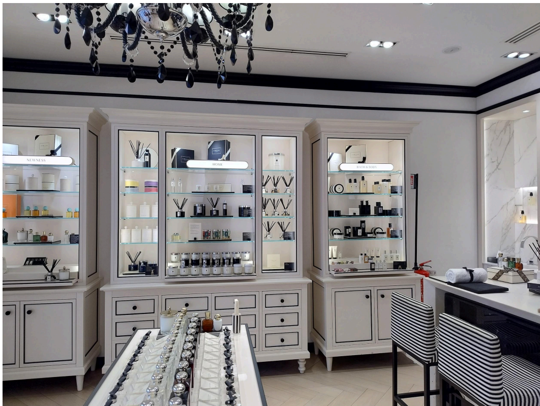
Vista interno Piano Terra