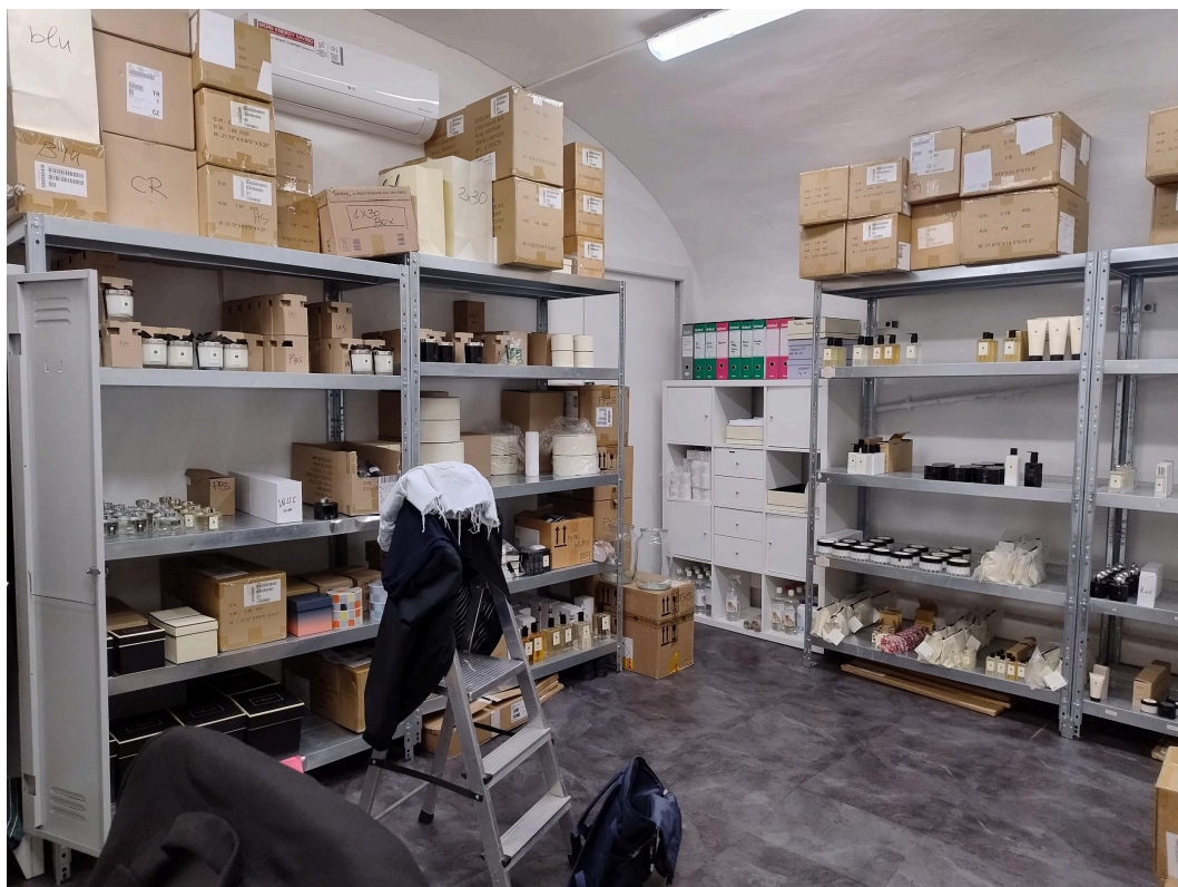
Magazzino piano ammezzato