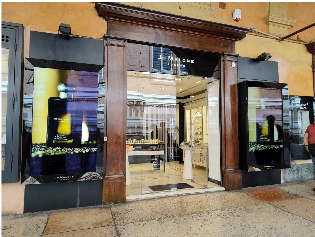
Vista vetrina Via Dell'Archiginnasio n. 2/F