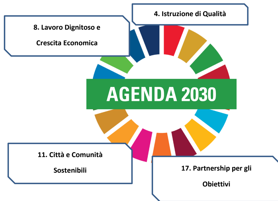
Tab. 1 Raccordo tra Framwork competenze PA e Agenda 2023 – Progetto Fast for the future